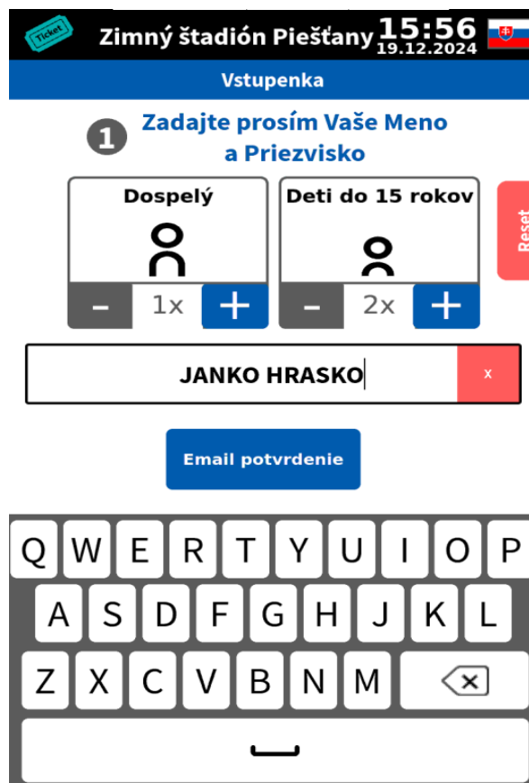
Obrázok 1: Úvodná obrazovka

Na úvodnej obrazovke vidíme dva typy lístkov a to konkrétne „Dospelý“ a „Deti do 15 rokov“. Pomocou tlačidiel „+“ a „-“ si vyberáme počet vstupeniek pre jednotlivé osoby, pre ktoré budeme kupovať lístok. Tlačidlom „Reset“ vyresetujeme počet vstupeniek. Následne do prázdneho poľa napíšeme naše meno a klikneme na tlačidlo „Email potvrdenie“.