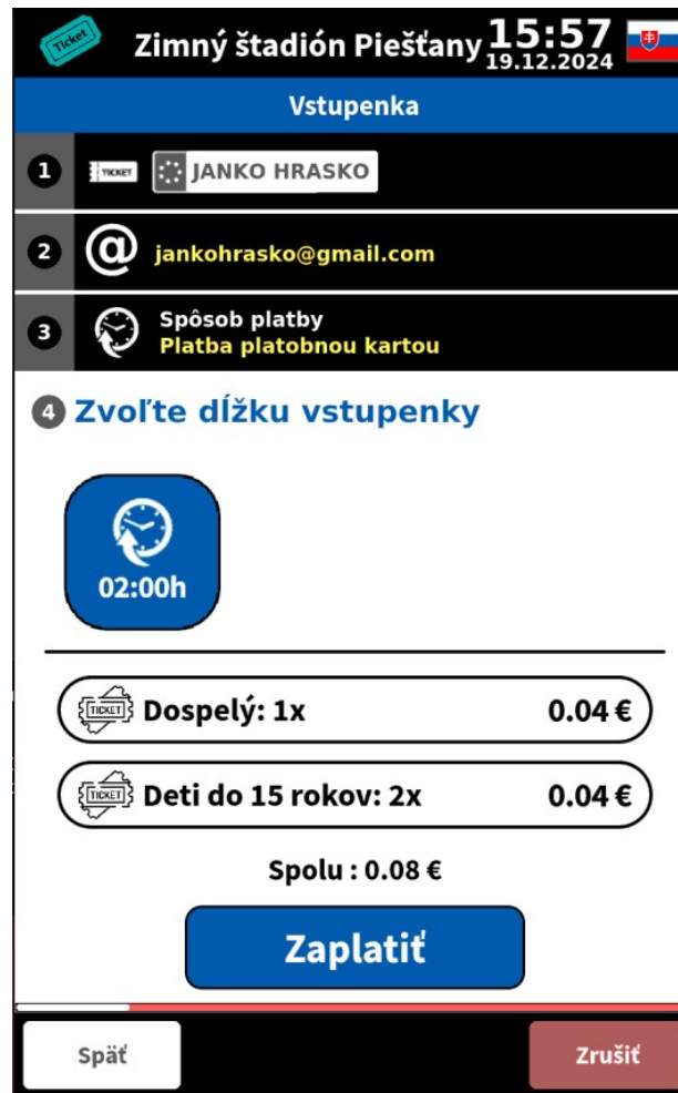
Obrázok 4: – Rekapitulácia

Po potvrzení emailu sa nám zobrazí obrazovka, na ktorej môžeme vidieť rekapituláciu nášho nákupu. V hornej časti vidíme naše meno, email, spôsob platby . Ďalej vidíme dĺžku vstupenky, počet jednotlivých vstupeniek a cenu .